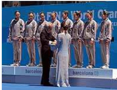
Goud voor Japan

Op de wereldkampioenschappen in Barcelona word voor het eerst de "Free Routine Combination" of kortweg COMBO gezwommen. Dit nieuwe onderdeel is een 5 minuten durende routine waarin solo, duet en team afwisselend uitgevoerd worden door maximum 10 zwemsters. De eerste gouden medaille voor de COMBO ging naar Japan. Spanje en USA deelden het zilver.