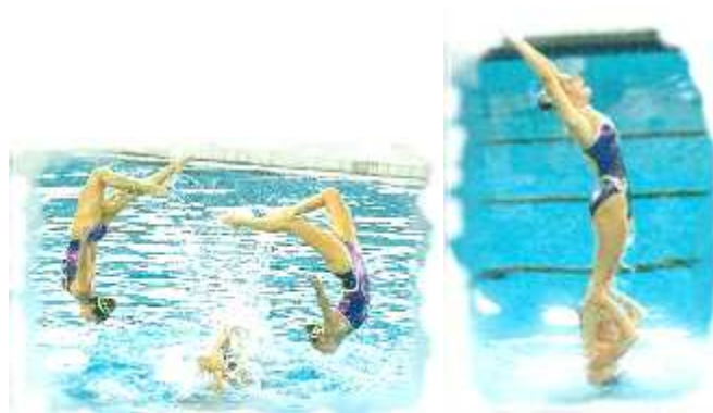
Team USA - GOUD op OS 1996

Er worden enkel teams gezwommen tijdens de Spelen van Atlanta