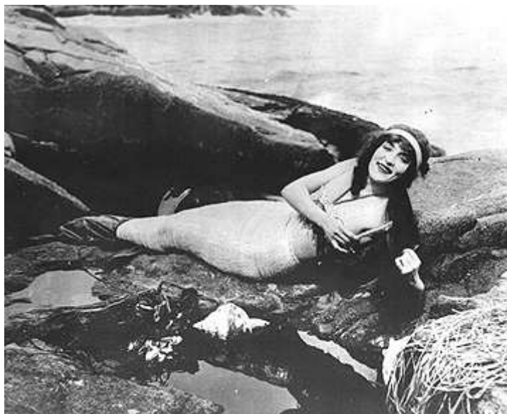
Annette Kellerman - 1916